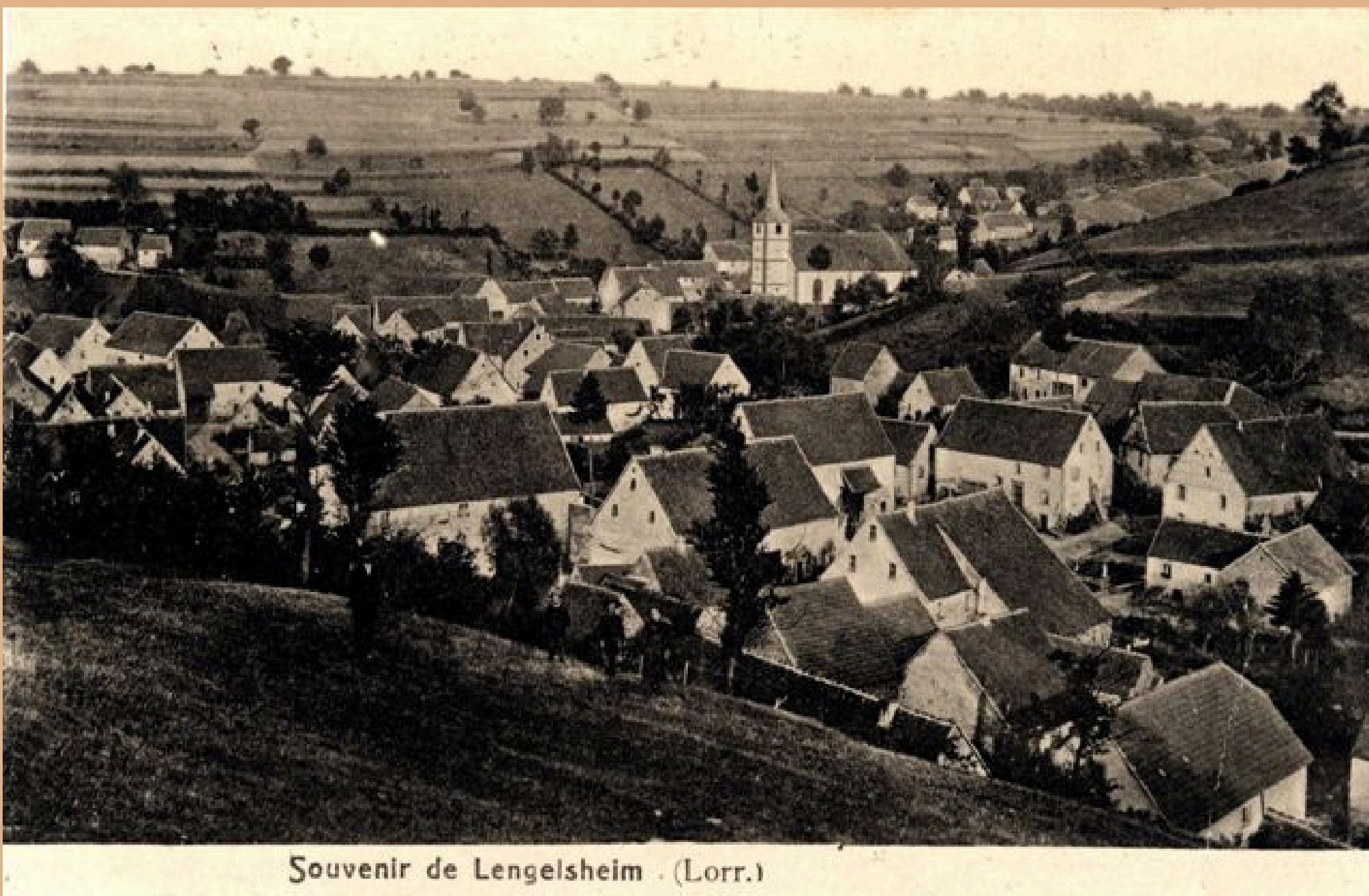
Souvenir de Lengelsheim . (Lorr.)

DES CHAUSSURES ET VÊTEMENTS ADAPTÉS À LA RANDONNÉE SONT NÉCESSAIRES.