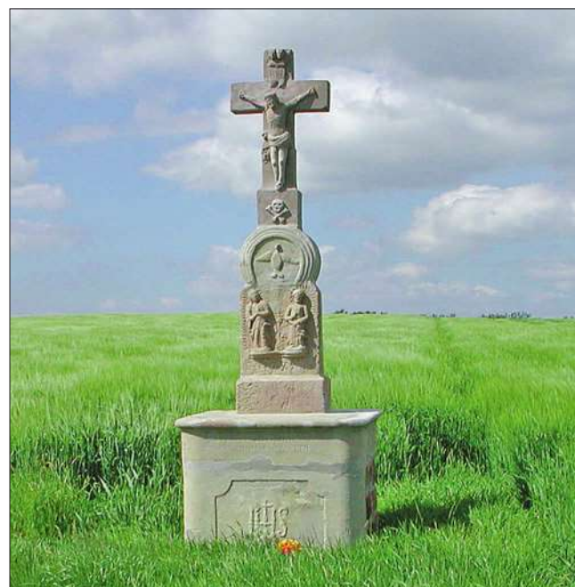
Nousseviller, un calvaire restauré.

Haspelschiedt , qui se rend à l'armée, malgré son Ring et son vénérable polissoir.