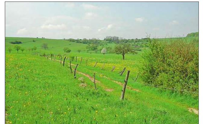
Breidenbach, le pays ouvert.

Petit-Réderching est fier de servir de porte au pays ouvert vers la France.