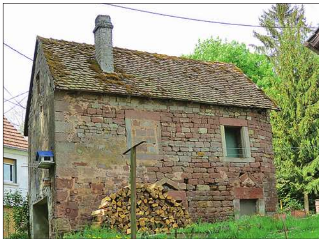
Weiskirch, chaumière en pierres de taille récupérées.

La seigneurie de Bitche apparaît comme une possession du duché de Haute-Lorraine dès 1047. Elle entre dans le domaine de Gérard d'Alsace (1048-1070), duquel descend la première famille ducale qui régna sur