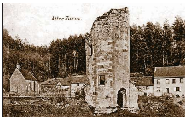
Mouterhouse, la Wasserburg.