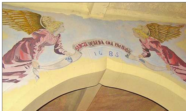
Enchenberg : Chapelle Ste Vèrene, date de construction.

conquérant et mettant à sac une grande partie de la Lorraine. Les ravages de la guerre, auxquels s'étaient rajoutées les épidémies, les famines, les exactions de toute sorte creusèrent une telle hécatombe que divers villages disparurent définitivement, plusieurs furent ruinés à un point tel qu'il ne restait plus que quelques rares familles survivantes. La plupart des historiens admettent aujourd'hui que la bataille d'Allemagne, en ses diverses parties, mais surtout dans le comté de Bitche, connut une mortalité telle que la population disparut, dans une proportion qui va de la moitié jusqu'aux trois quarts.