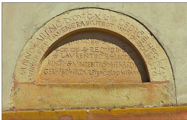
Schorbach : pierre dédicatoire de l'église.