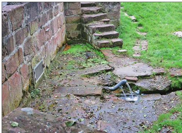
Mouterhouse, la source captée.

Les désordres de tout ordre qui agitérent la Lorraine et principalement le bailliage