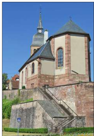
Schorbach, l'église romane.

La Lotharingie, qui échet à Lothaire, l'aîné des petits fils de Charlemagne (Lothaire, Charles et Louis) lors du partage du bel empire à Verdun en 843, connut le destin d'un royaume éphémère à l'existence tourmentée et ballottée entre Francie et Germanie. Il consistait en un espace longiligne de-