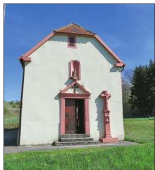
Guiderkirch : chapelle Ste Anne.

Comme si le malheur venu de l'étranger ne suffisait pas, l'imprudent Duc Charles IV avait multiplié les provocations politiques envers le tout puissant Premier Ministre du roi de France, le Cardinal de Richelieu. Celui-ci se servit de tous les prétextes pour faire avancer l'armée du Roi vers l'Est,