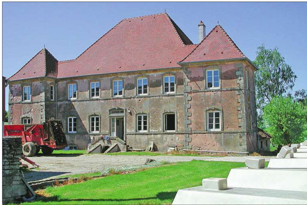
Olfarding, la ferme-château, à Gros-Réderching.

Hanviller , gardienne vigilante de la Horn, d'où l'on va au Gintersberg.