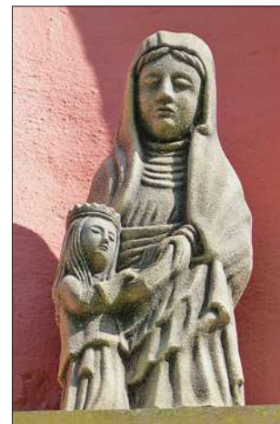
Guiderkirch, Sainte Anne et la Vierge.

malheurs de la Guerre de Trente Ans. «Le bailliage d'Allemagne, - auquel on peut rattacher dès 1572 le comté de Bitche - connu à la fin du XVI ème et au début du XVII ème siècle une incontestable activité économique due à certains facteurs favorables. L'intervention des ducs dans la vie économique intéressait tout le duché de Lorraine, mais le bailliage d'Allemagne en profita largement. Les ducs furent d'ailleurs soutenus par la Chambre des Comptes de Lorraine, qui exerçait une surveillance sur l'économie du pays. De plus, le gouvernement ducal fut secondé par un personnel d'officiers, en général assez expérimenté.»