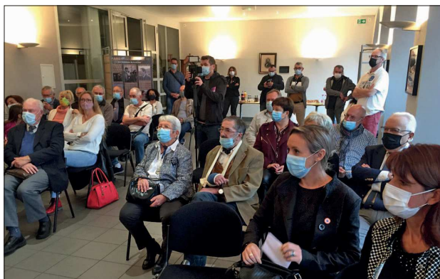
Les invités au soixantième anniversaire de la section de la S.H.A.L. du pays de Bitche.